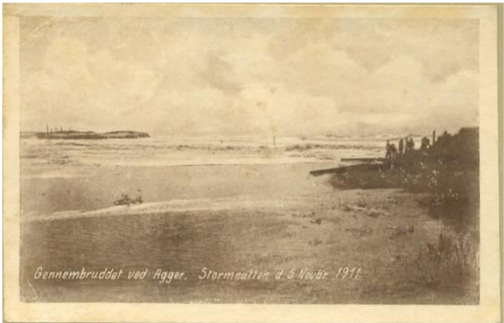
Gennembruddet ved Agger. Stormnatten d. 5. Novbr. 1911