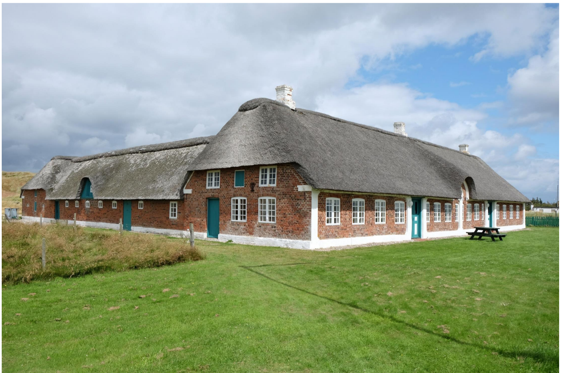
Strandgården "Abelines Gård" syd for Hvide Sande.