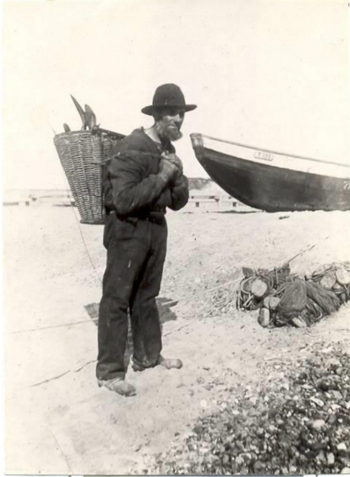
Fisker med fiskekurv på ryggen