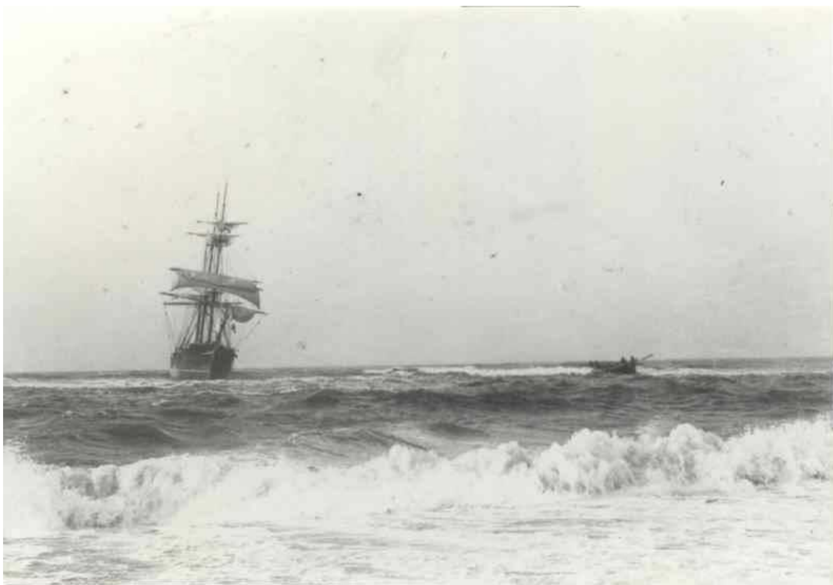
Et strandet skib og redningsbåden, der er på vej ud til skibet