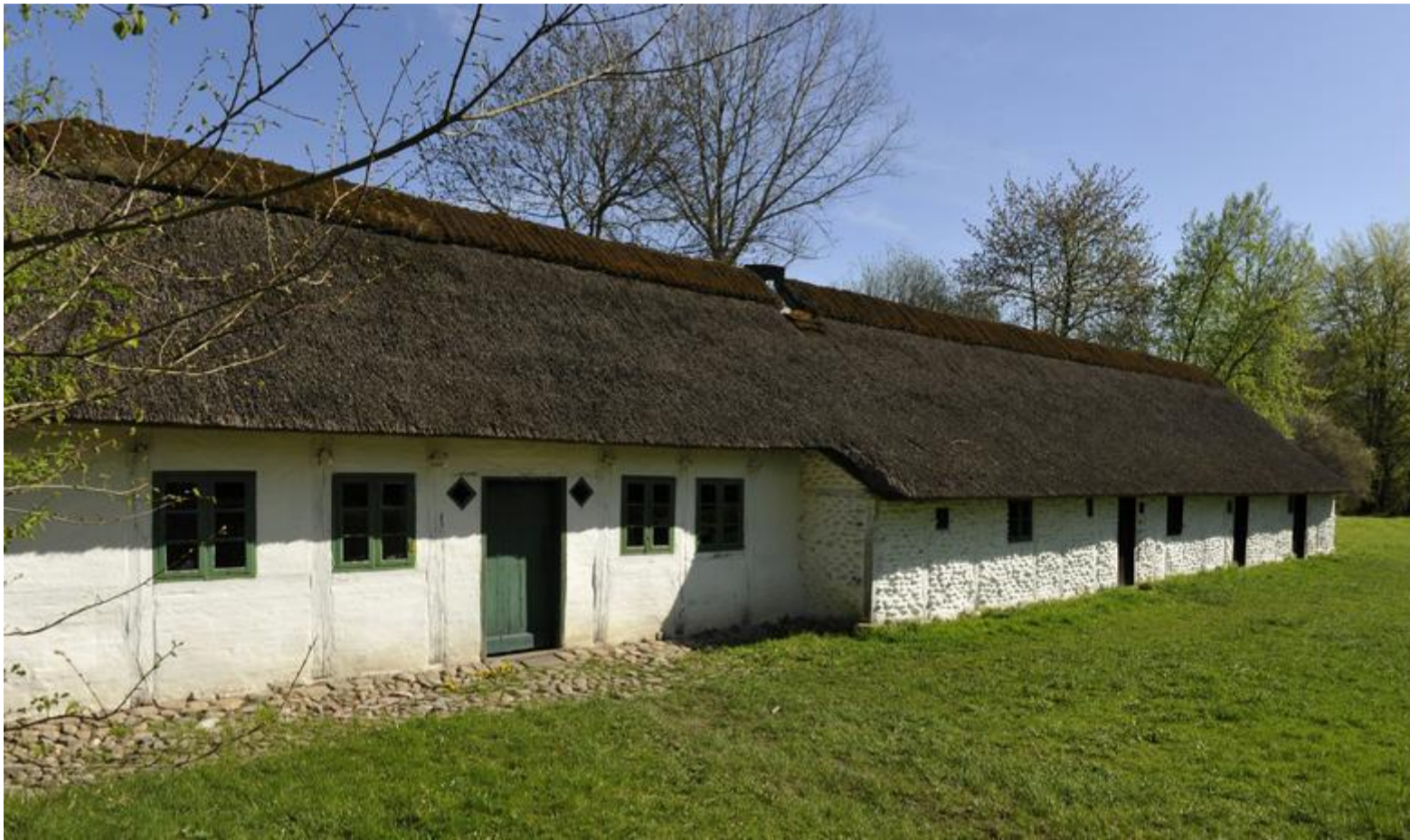
Et fiskerhus fra Agger. Står nu på Frilandsmuseet i Nordsjælland.