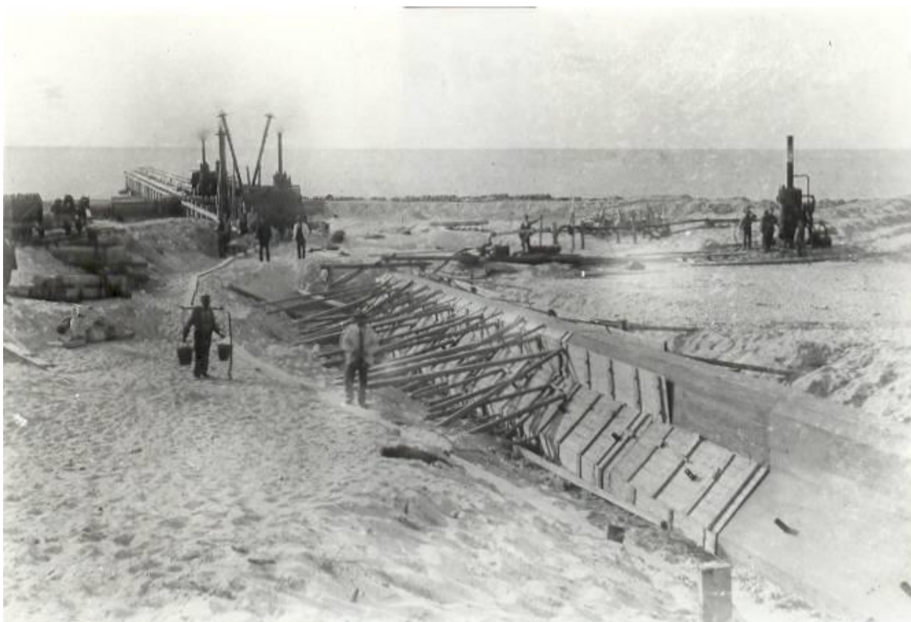
Kystsikring bygges 1900-1908