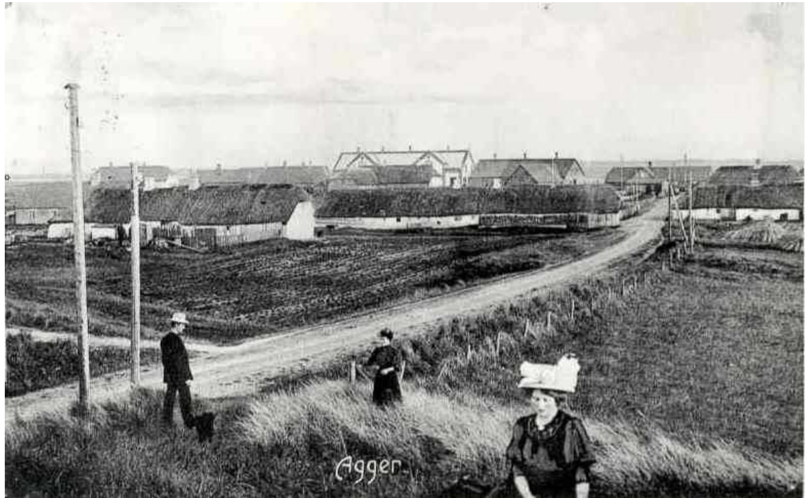
Huse og gårde i Agger